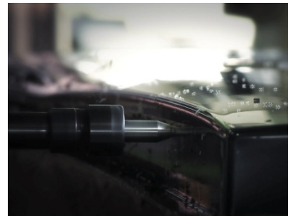
자동화된 정밀기기를 통해 생산되는 SAVANA VAN의 파트들