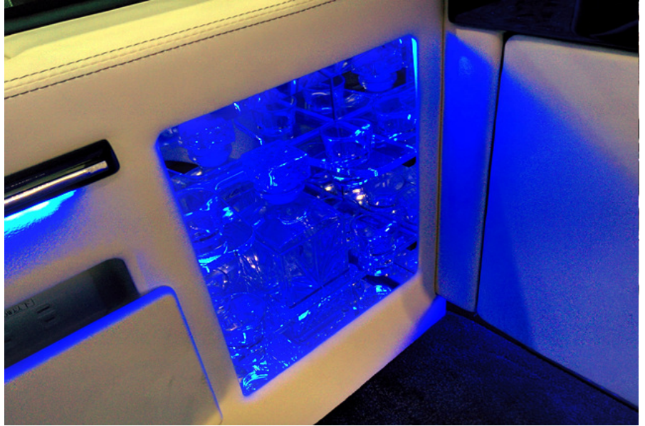
럭셔리한 느낌의 와인바 내장

은은하고 멋스러운 분위기의 와인바가 차량측면에 위치하여 언제든지 차량 안이 즐거운 파티장 및 고급 바가 될 수 있도록 하였습니다. 운전석쪽에는 대형 쿨러가 함께 설치되어 있어 비즈니스, 가족여행 등에 편리합니다.