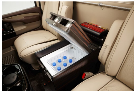
대형 쿨러 설치