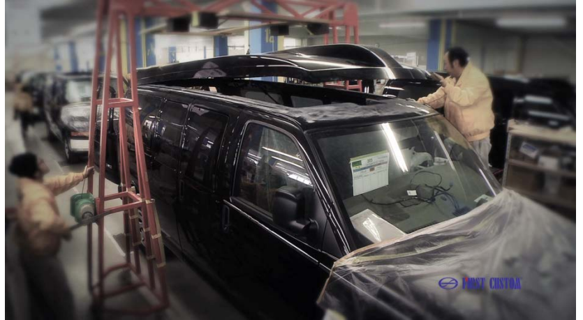
토요타자동차의 생산라인에서 조립중인 SAVANA VAN

GMC SAVANA VAN은 생산공정 및 관리가 까다롭기로 소문난 일본 토요타자동차의 특수차 생산공장인 퍼스트 커스텀(FIRST CUSTOM)에서 내외장 컨버전 작업이 진행됩니다. 대량 양산 조립공정을 따라 생산되므로 마감 퀄리티는 여타 컨버전밴과 비교할 수 없습니다.